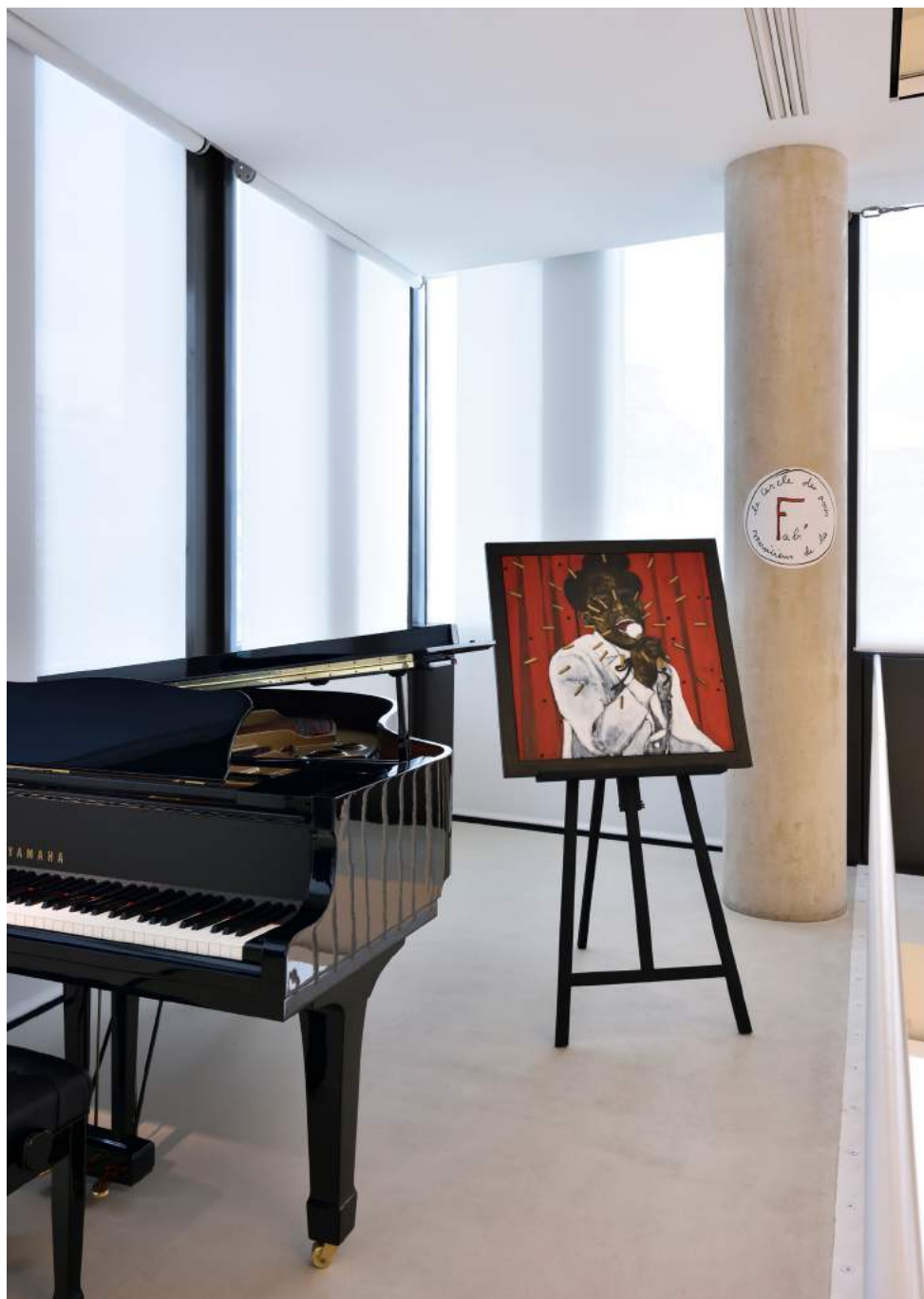
Vue de l'exposition Regards hors champ et Paysages dans la collection agnès b.