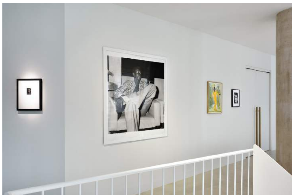
Vue de l'exposition Regards hors champ et Paysages dans la collection agnès b. © Rebecca Fanuele. La Fab. / collection agnès b.