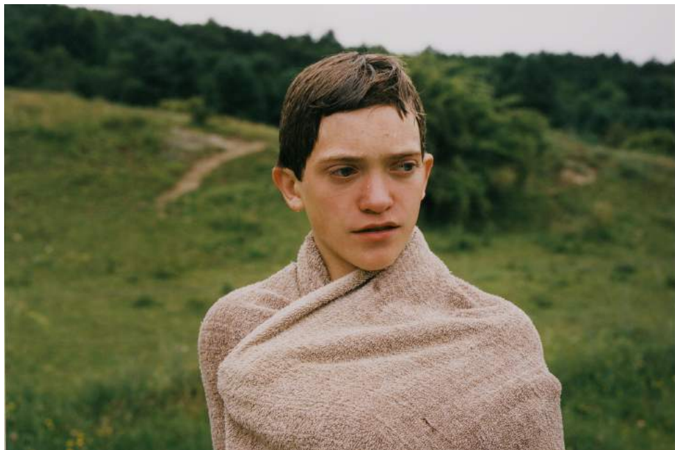
Clare Richardson, Sans titre I , de la série « Harlemville », 2000. Photographie couleur, 50,8 x 61 cm