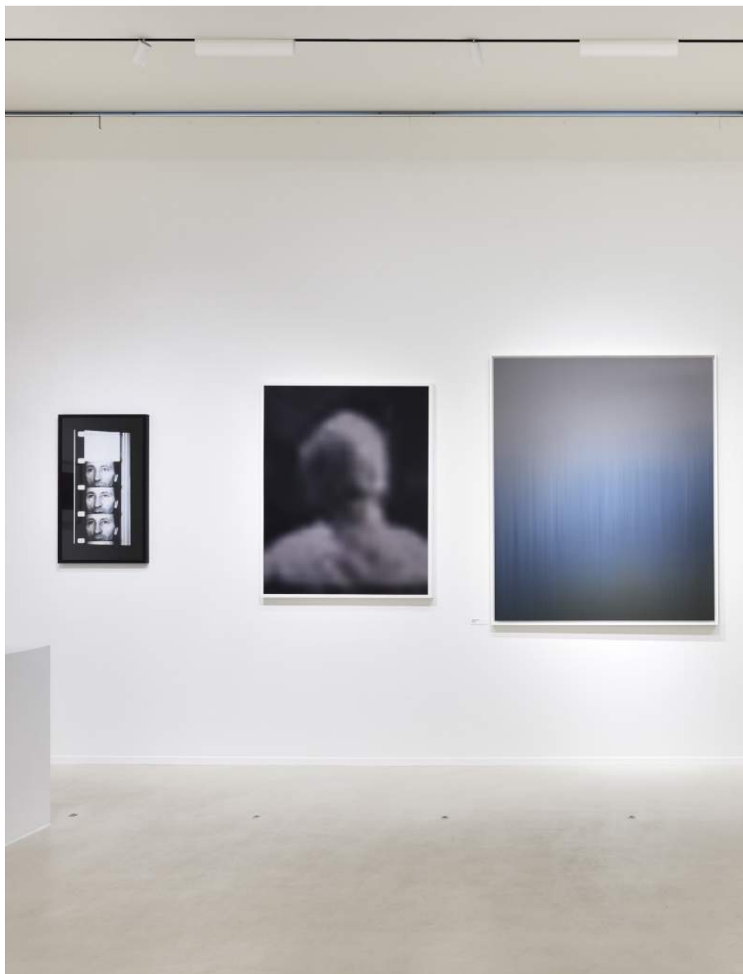
Vue de l'exposition Regards hors champ et Paysages dans la collection agnès b.