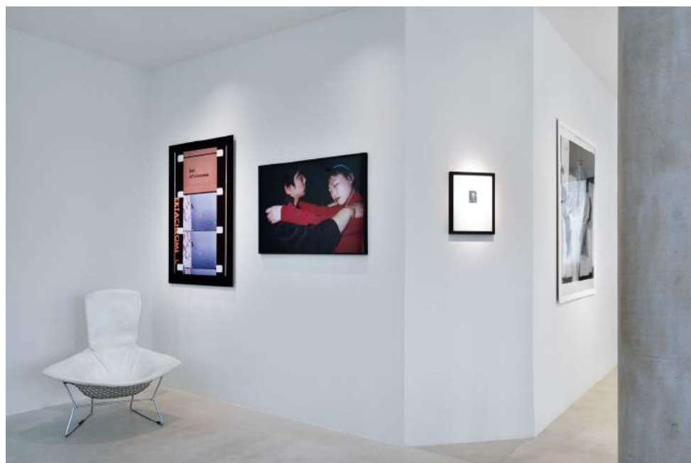
Vue de l'exposition Regards hors champ et Paysages dans la collection agnès b.