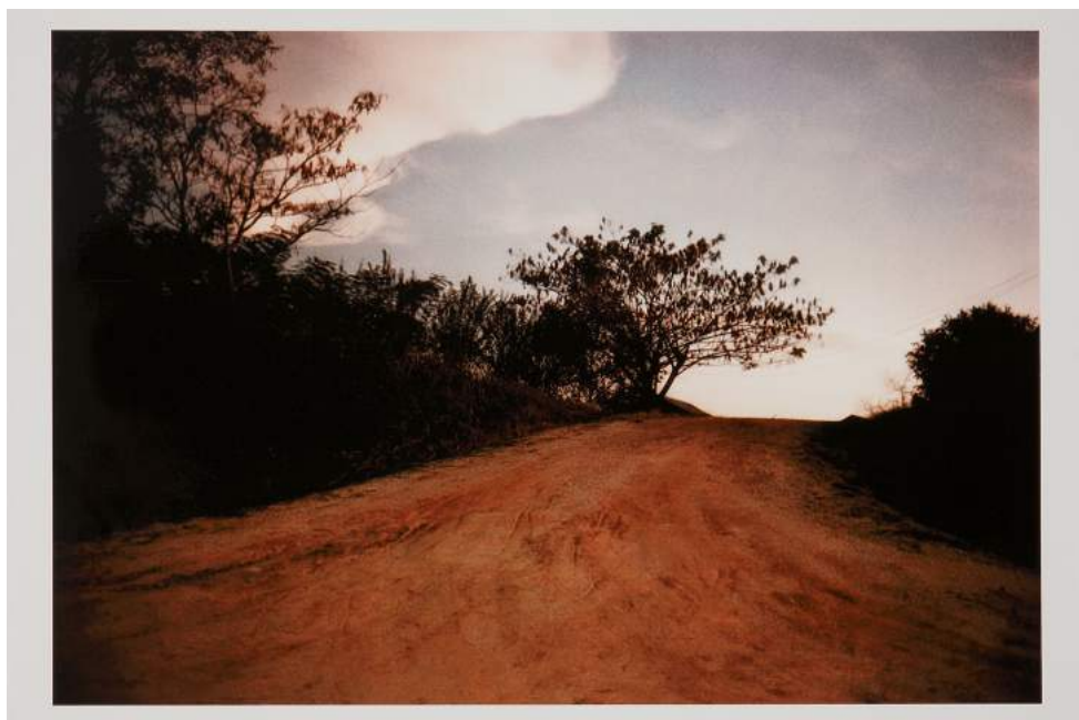
William Eggleston, Sans titre , Tirage chromogénique, 27 x 34,5 cm © Courtesy de l'artiste et collection agnès b.