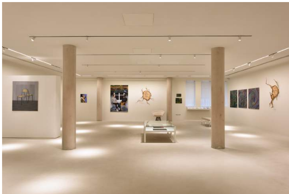
Vue de la galerie du jour agnès b.

Hybride et adaptable, la galerie du jour est aussi un vecteur de soutien à la jeune création et de décloisonnement des disciplines et des publics, s'opposant ainsi aux diktats et au formatage imposés par le marché de l'art et à la spéculation financière qui en découle.