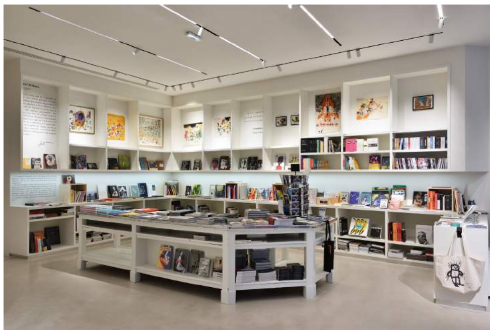
Vue de la librairie du jour agnès b.

En étroite collaboration avec la galerie du jour et la collection agnès b., un programme de signatures, de conférences et de rencontres d'artistes viendra rythmer l'actualité de la librairie.