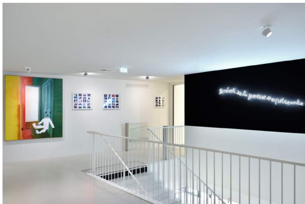
Vue de l'exposition Regards hors champ et Paysages dans la collection agnès b.