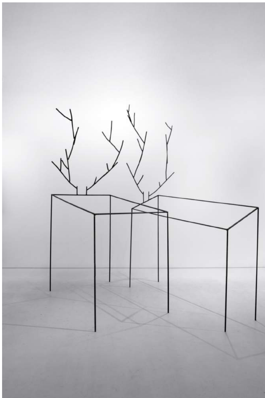
Vue de l'exposition Regards hors champ et Paysages dans la collection agnès b.