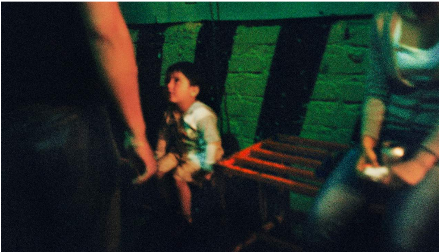
JULIEN ALLOUF SANS TITRE, AOÛT 2014

MEXICO DE JULIEN ALLOUF - EXPOSITION PHOTOGRAPHIQUE DU 21 JANVIER AU 27 FÉVRIER 2021 - LIBRAIRIE DU JOUR