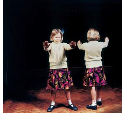
Wendy McMurdo The Somnambulist, 1995