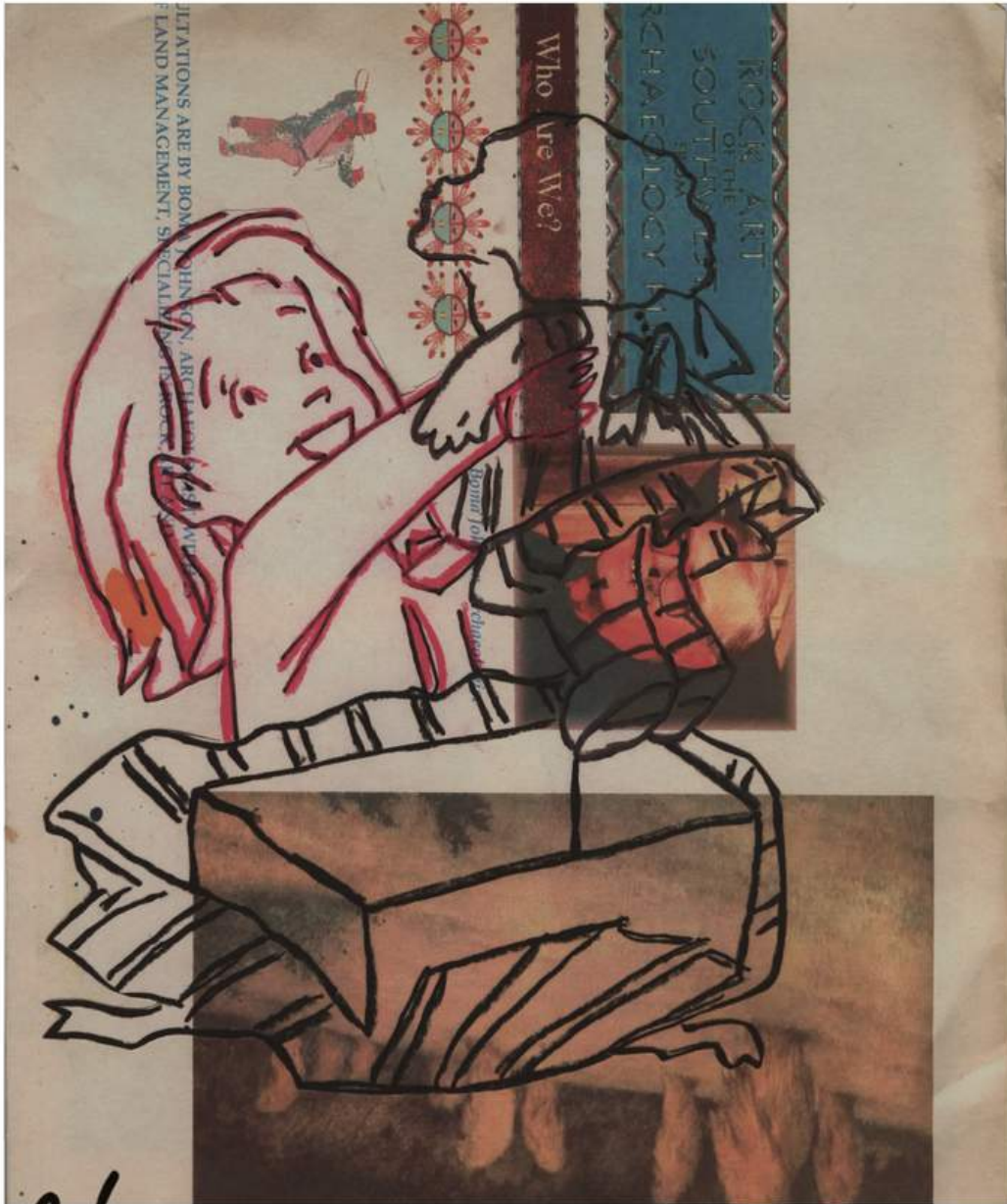
Sister Berlin (Of the Red Army) © Harmony Korine, 2002