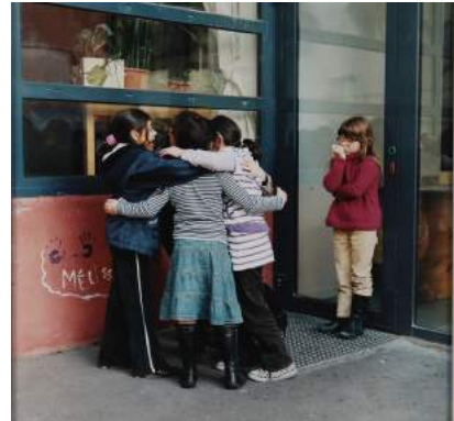
Marion Poussier Sans titre, de la série "Récréation", 2009