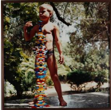
Florence Chevallier Sans titre (N°16), de la série "Des journées entières", 2000