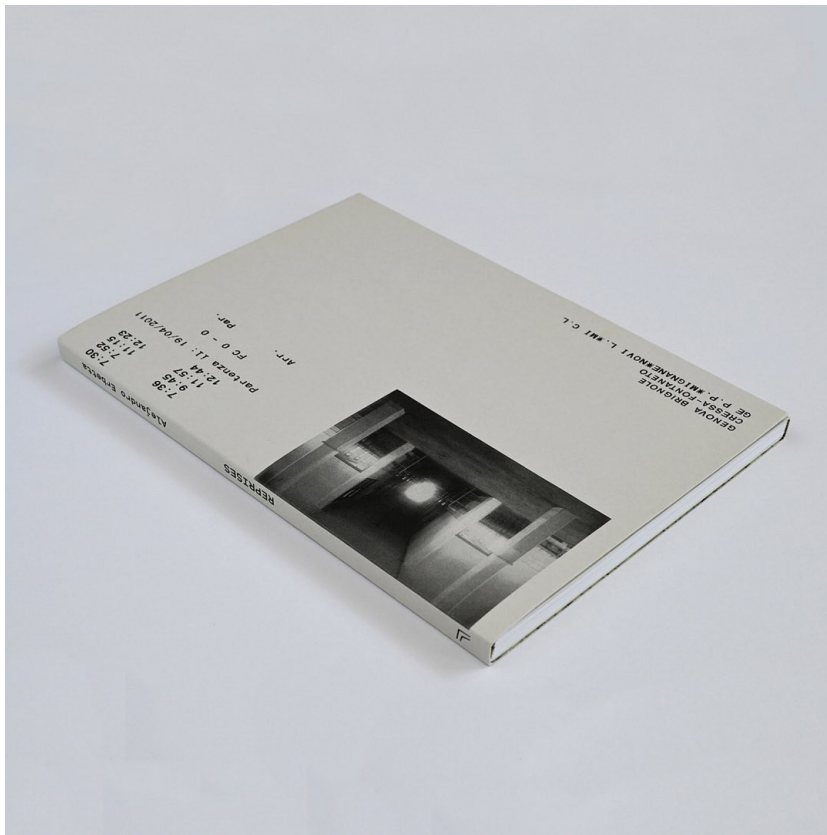
Reprises, Alejandro Erbetta, 2021. La Luminosa, Buenos Aires, Argentine.

En parcourant les régions du Nord de l'Italie, il a tenté d'aller à la rencontre d'une histoire individuelle et collective. Mais comment reconstruire notre propre histoire quand il y a des silences, des éléments qui nous échappent ou de l'inconnu? Peut-on reconstruire une histoire de manière fragmentée, dispersée, non-linéaire? Est-il possible de reconstruire le passé et la mémoire à travers la fiction et si oui, quelle est sa légitimité?