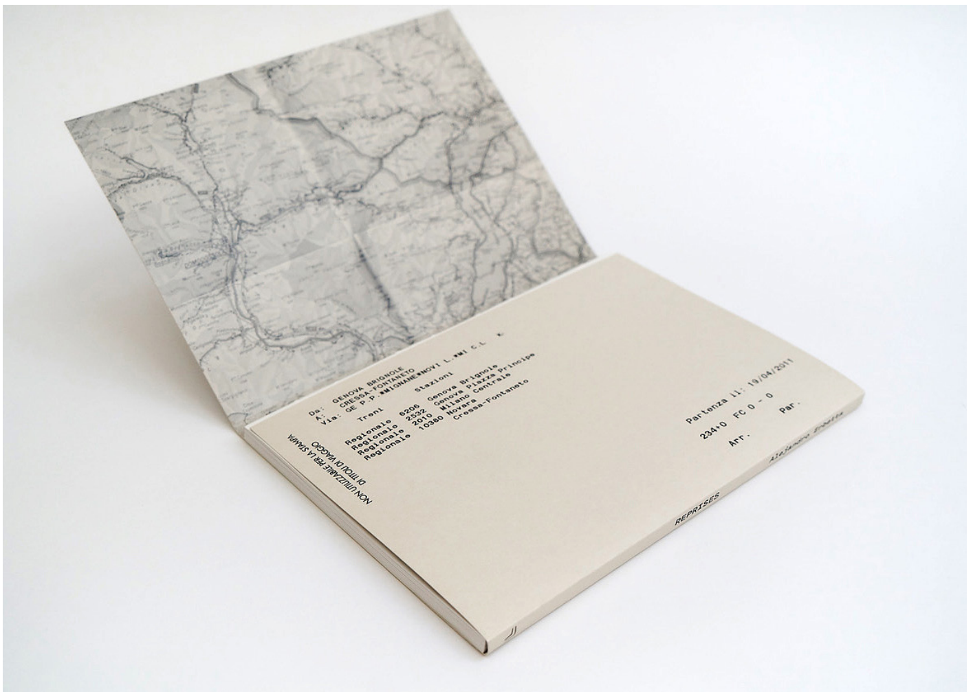
Reprises, Alejandro Erbetta, 2021. Edition bilingüe (espagnol-français). Editorial La Luminosa, Buenos Aires, Argentine.