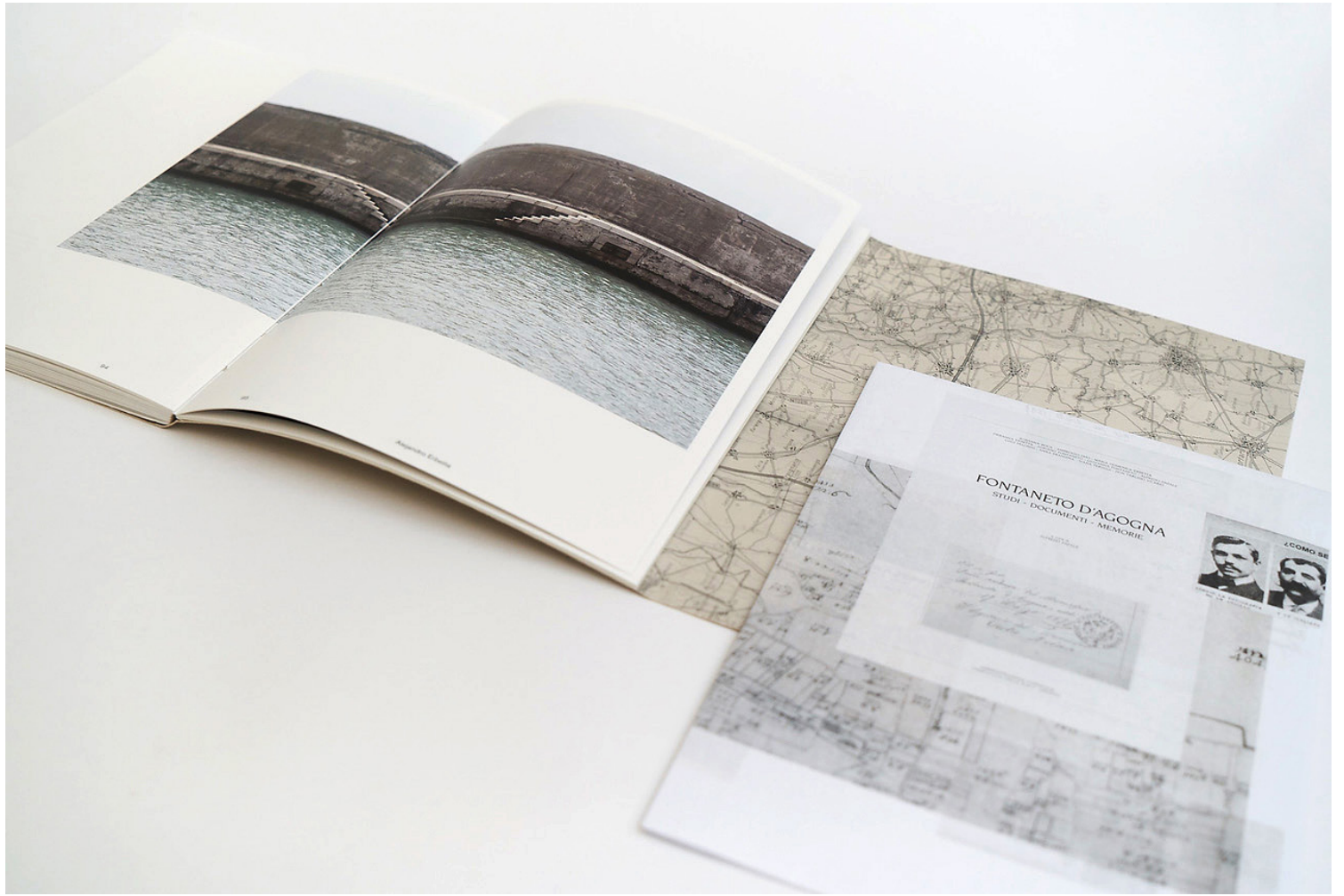
Reprises, Alejandro Erbeta, 2021. Edition bilingüe (espagnol-français). La Luminosa, Buenos Aires, Argentine.