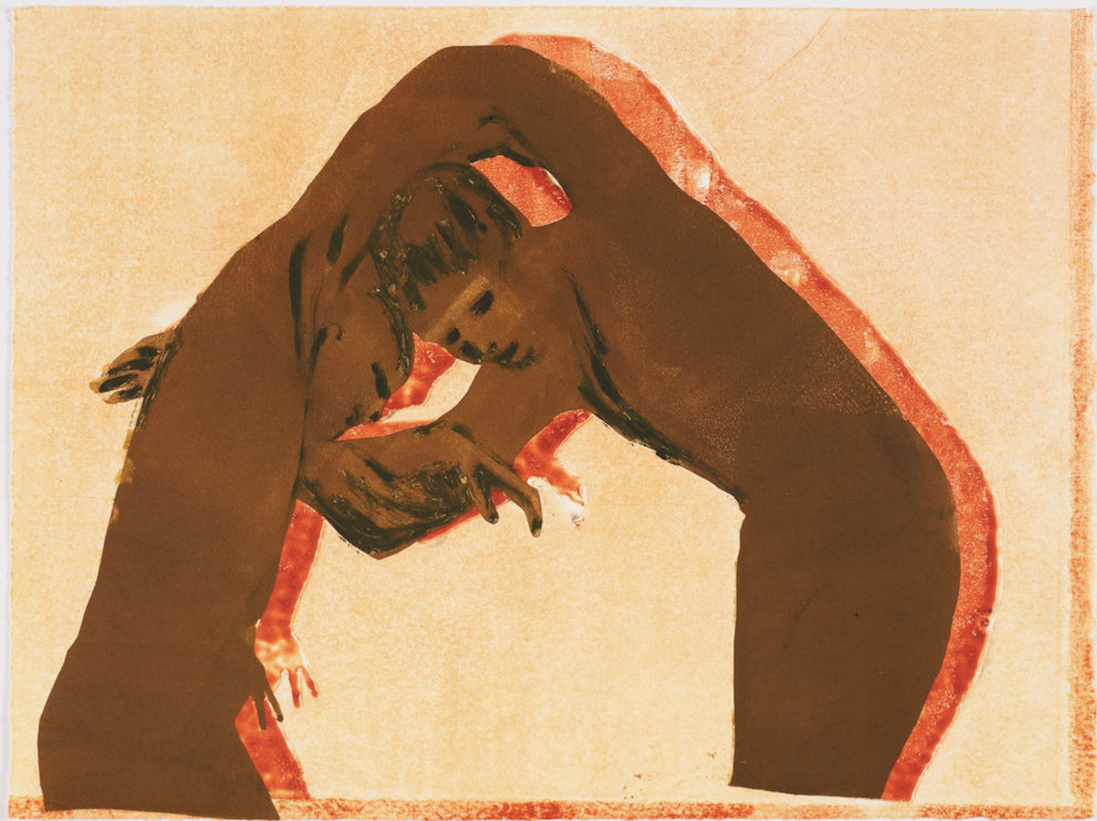
CLAIRE TABOURET, The Dance (red shadows), 2018 Courtesy l'artiste & Collection agnès b.