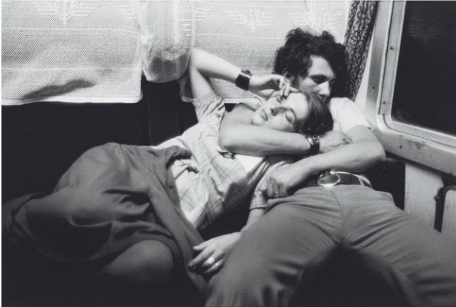
HENRI CARTIER-BRESSON , Couple dans le train, Roumanie, 1975