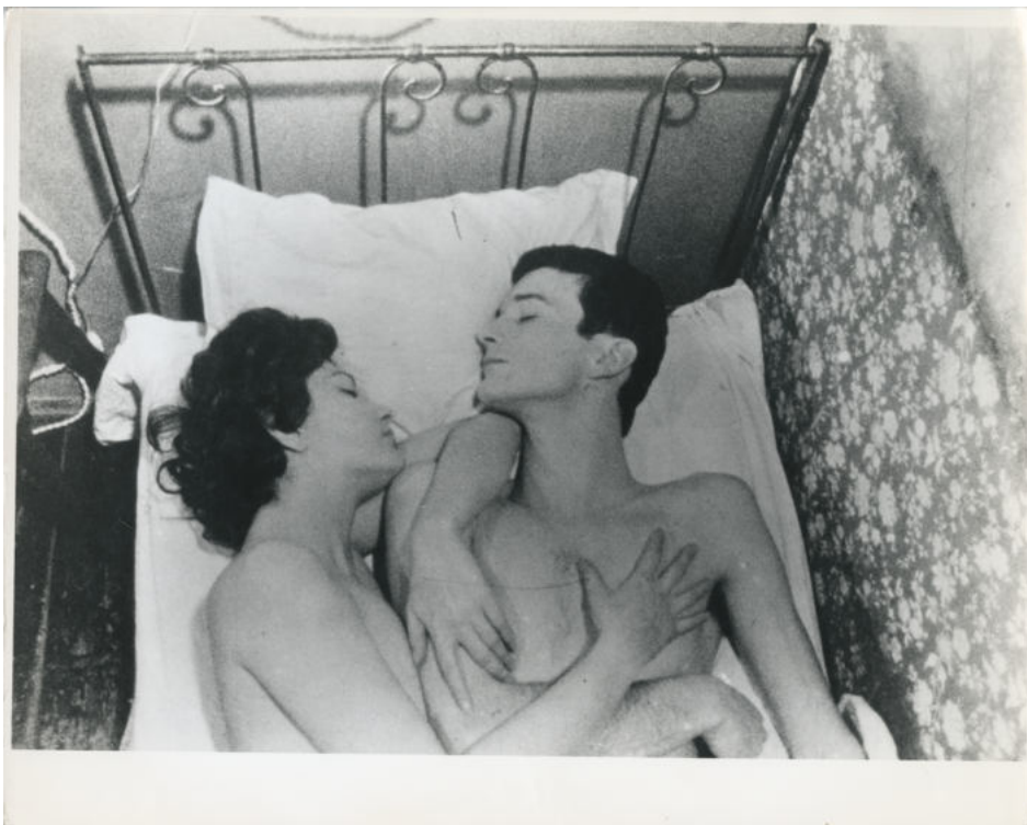
AGNÈS VARDA , Sans titre (l'Opéra-Mouffe), mars 1958