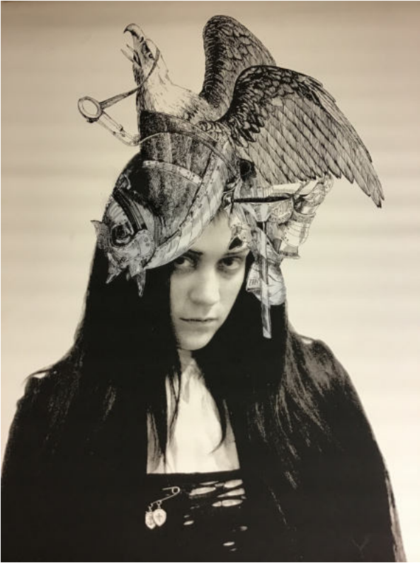
KENNETH CAPPELLO & BRIAN DEGRAW Sans titre 2 (Chloé Sévigny), 2003

Courtesy des artistes & Collection agnès b.