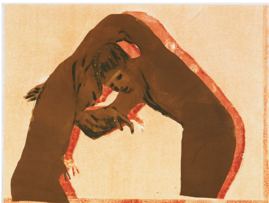
CLAIRE TABOURET , The Dance (red shadows) , 2018