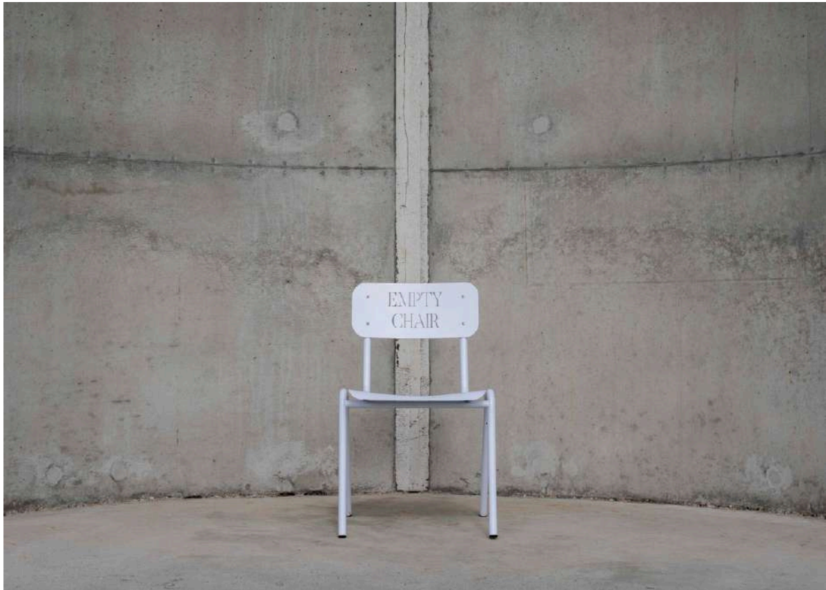
Empty Chair © Erik Kessels