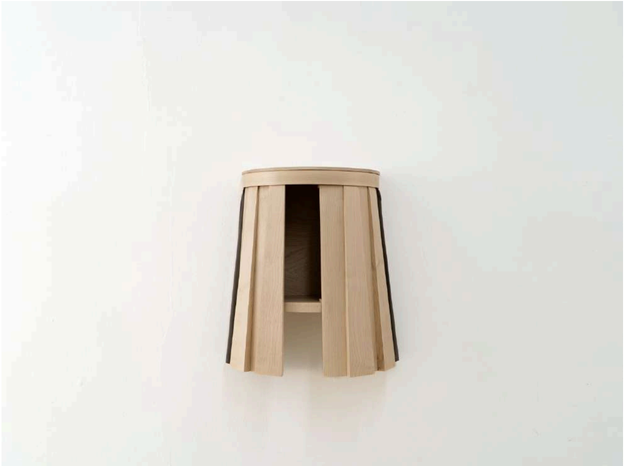
Baby doll #2, 2025 48,7 x 25 x 40,3 cm Érable, vernis, tissu

© Marion Chaillou Coursesy de l'artiste et de la galerie Jousse Entreprise, Paris